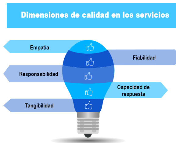
Figura 1. Dimensiones de calidad en los servicios de salud

El estudio tuvo como objetivo determinar el nivel de satisfacción en los pacientes atendidos por odontólogos graduados de la UEES en el sector privado —colonias Escalón, San Benito y El Carmen—. La satisfacción que proviene de los servicios odontológicos depende de la singularidad del paciente, entre esto se destaca la edad, el sexo, el nivel educativo, posición socioeconómica y el estado de su salud. Todo en conjunto genera una influencia en el paciente para la toma de decisiones del tratamiento a sugerir por el profesional y dependiendo de esto se produce una repercusión en la satisfacción del usuario.